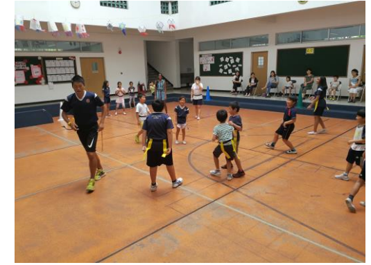
6/15 テーマ「スポーツで交流しよう」