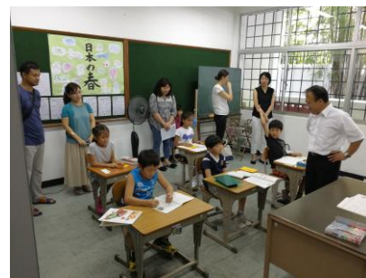
←小学部 2, 3年