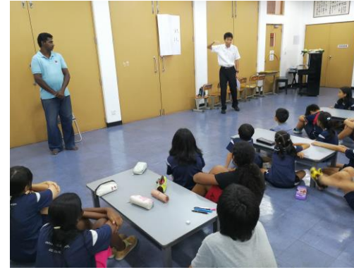
5/25 テーマ「私の気持ちを伝えよう」

本年度のIAの時間がスタートとしました。全校一斉の授業で、この時間をとても楽しみにしていた子どもたちも多いようです。IAは身近な問題から世界にまで目を向け、子どもたちの知識や考えを深める時間として始まりました。IAは、コロンボ日本人学校の特色のひとつとなっています。この時間に扱う内容は、現地理解や環境教育、平和教育、文化と宗教、音楽からスポーツと、多岐にわたっています。