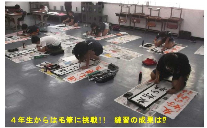
4年生からは毛筆に挑戦!! 練習の成果は!!