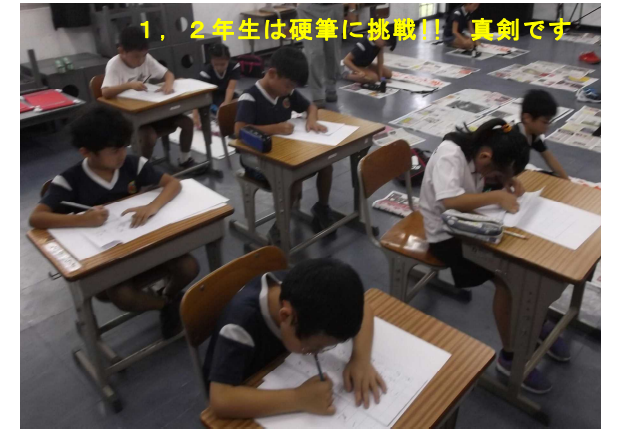
1, 2年生は硬筆に挑戦!! 真剣です