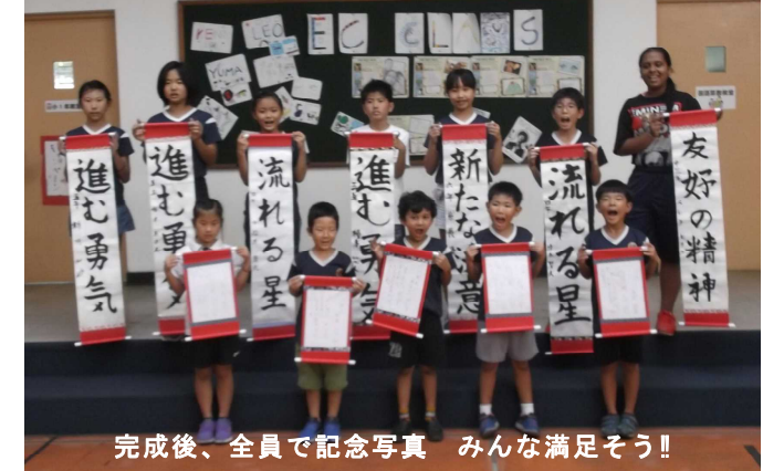
完成後、全員で記念写真 みんな満足そう!