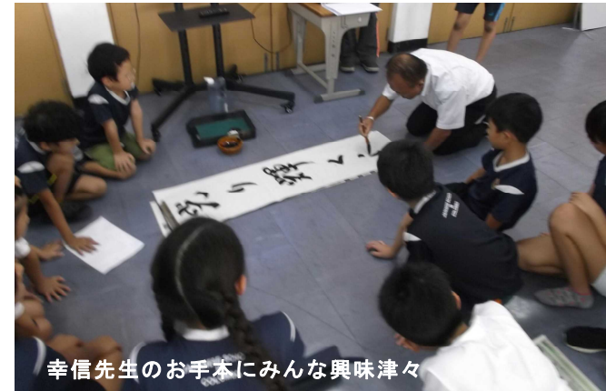
幸信先生のお手本にみんな興味津々

始業式のあった6日の午後から書初め大会が行われ、全校児童生徒がお手本を見ながら今年の思いを込めて(?)、小学部1, 2年は硬筆で、中学年以上は毛筆で作品を完成させました。