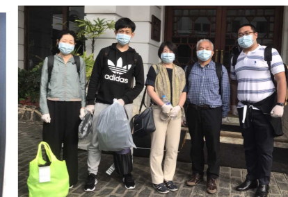
到着日に隔離ホテル前で