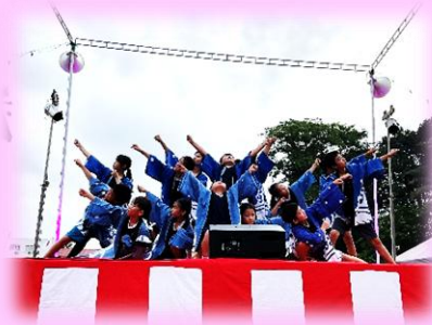
盆踊り大会への出演