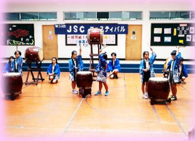
JSC フェスティバルでの和太鼓と南中ソーランの発表