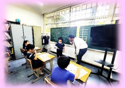
週3回のEC(英会話)授業