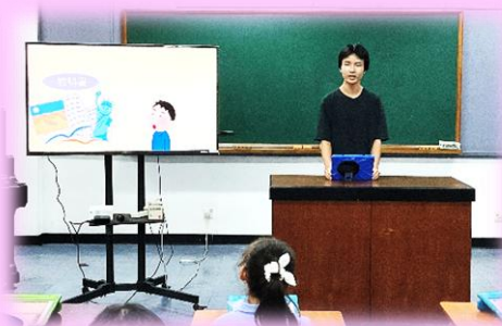
思考力・表現力に焦点を当てた校内研究