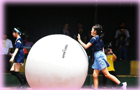
日本人会との合同運動会