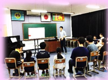
国際理解教育(International Activity)の公開授業