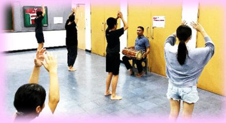
現地理解教育(キャンディアンダンス)