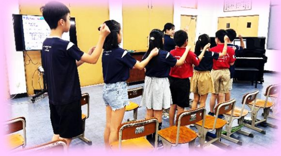
他校との交流活動

【対象】 令和8年度 小学部・中学部への新入学・編入学希望者 及びその保護者（保護者の方のみの参加もできます。）