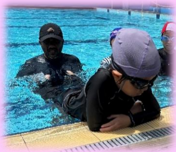
現地コーチから学ぶ水泳学習